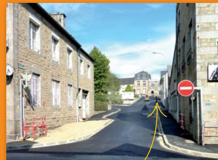
Rue Guillaume Le Conquérant