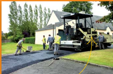
Cité des Bruyères