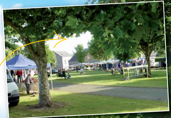
Marché semi nocturne