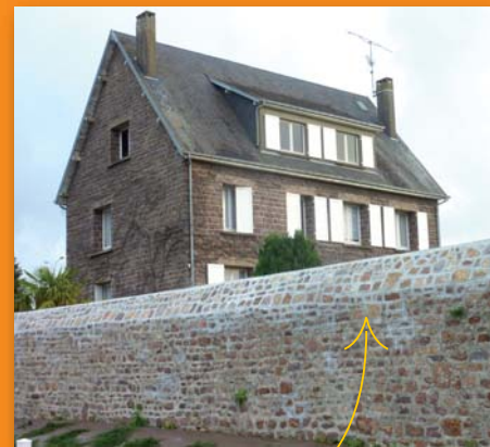
Mur du presbytère