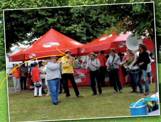
Pique-nique 100ème anniversaire de la Normandie